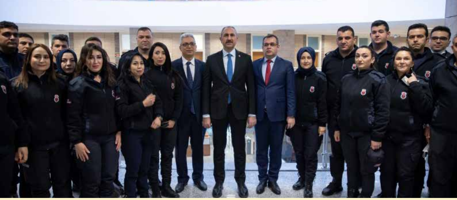
Adalet Bakanı Abdulhamit Gül, Adana'da Valilik, Adliye, Bölge Adliye Mahkemesi ve Baro'yu ziyaret etti.