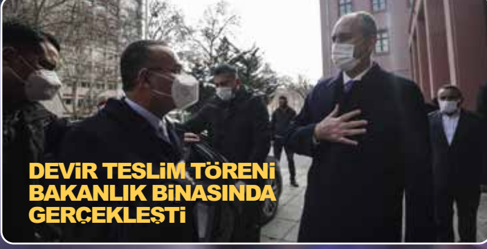
DEVİR TESLİM TÖRENİ BAKANLIK BİNASINDA GERÇEKLEŞTİ

Cumhurbaşkanı Recep Tayyip Erdoğan imzasıyla Resmi Gazete'de yayımlanan kararda, Adalet Bakanlığı'na atanan Bekir Bozdağ, görevi Abdulhamit Gül'den devraldı.